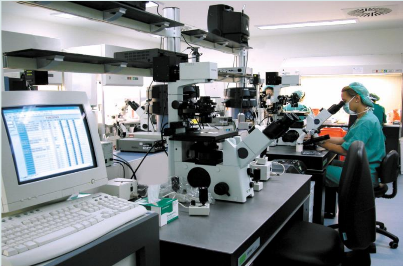
Ejemplo de un Laboratorio FIV