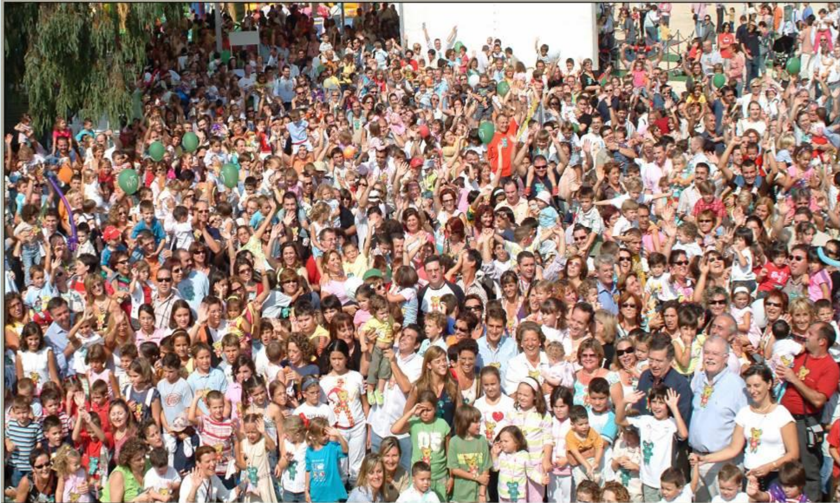
Foto de la fiesta de los niños en el 15º Aniversario